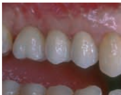
Abbildung 4: Zirkon-Kronen

Implantate werden vom Organismus in der Regel als körperfremd erkannt. Durch moderne Forschung ist es zwar gelungen Materialien zu entwickeln oder zu verwenden, die möglichst schwache Immunreaktionen nach sich ziehen, aber ganz unterdrücken kann man das nicht einmal mit Materialien wie Titan.