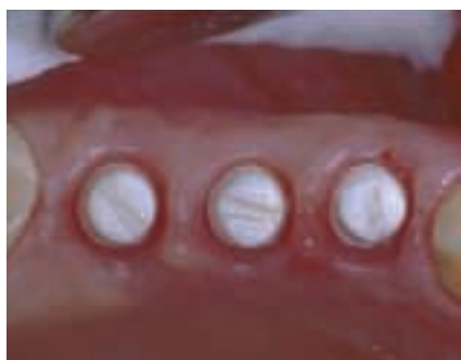
Abbildung 3: Zirkon-Implantate

Dazu wurden die Implantate in ihrer sterilen Verpackung mit den Schwingungen folgender Einträge informiert: Arnica D4, Symphytum D3, Knochencompacta D2, Harmonische Regulation LM 50. Abgesehen davon läuft alle 4 Stunden für 10 sec. im Dauerprogramm ein von der Diode mit weissem Rauschen ermitteltes Programm mit folgenden Einträgen: