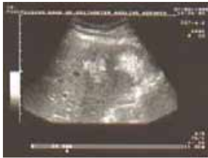
Diese Ultraschall-Aufnahme eines Leber-CA-Patienten wird durch Potenzierung zur patientenspezifischen Leber-CA-Nosode.

Metallen, pflanzlichen oder tierischen Urtinkturen vor allem auch aus Heilmitteln hergestellt werden, Nosoden dagegen ausschließlich aus krank machenden Giften, Bakterien, Viren oder aus Krankheiten selbst. Schon Hahnemann hatte damit begonnen Homöopathika aus Krankheiten herzustellen, in dem er die Mittel Tuberkulinum, Psorinum, Medhorinum und Luesinum einführte, die er damals als „Miasmen“ bezeichnete. Später kamen dann noch andere Nosoden aus Krankheiten hinzu, von den die Bekannteste Carcinosinum ist, ein homöopathisch hergestelltes Mittel aus dem Brustkrebs-Gewebe einer Frau.