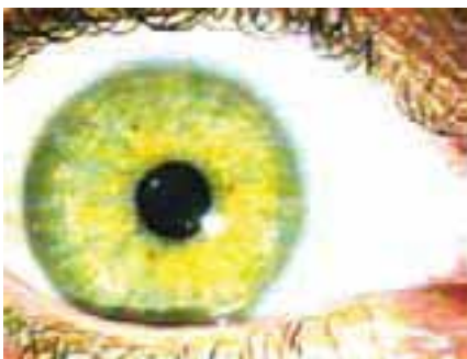
Alle Erkrankungen, die dieses Auge anzeigt . . .

Vor allem die seit Begründung der Homöopathie neu aufgetauchten Gifte werden heute als sogenannte Nosoden zum Heil- und Ausleitungsmittel gegen eben dasjenige Toxicum gegeben, dessen Namen sie tragen. Obwohl der Name suggeriert, dass es sich hier nicht um Homöopathie handelt, ist das Herstellungsverfahren und das Wirkprinzip dasselbe: Durch Potenzieren der Ursubstanz entsteht ein Heilmittel gegen die Symptome, die dasselbe Mittel in der Urtinktur verursacht. Der einzige Unterschied besteht darin, dass homöopathische Mittel neben Giften, Mineralien,