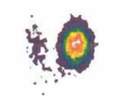
. . . die diese Schilddrüse anzeigt . . .

Metallen, pflanzlichen oder tierischen Urtinkturen vor allem auch aus Heilmitteln hergestellt werden, Nosoden dagegen ausschließlich aus krank machenden Giften, Bakterien, Viren oder aus Krankheiten selbst. Schon Hahnemann hatte damit begonnen Homöopathika aus Krankheiten herzustellen, in dem er die Mittel Tuberkulinum, Psorinum, Medhorinum und Luesinum einführte, die er damals als „Miasmen“ bezeichnete. Später kamen dann noch andere Nosoden aus Krankheiten hinzu, von den die Bekannteste Carcinosinum ist, ein homöopathisch hergestelltes Mittel aus dem Brustkrebs-Gewebe einer Frau.