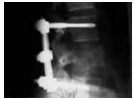
. . . werden durch die Potenzierung zur Nosode zum Heilmittel für die bildlich erfassten pathologischen Befunde.

Da in der Radionik davon ausgegangen wird, dass Bilder dieselbe Information enthalten, wie das abgebildete Objekt, können die oben erwähnten Begrenzungen hier aufgelöst werden. Durch Potenzieren einer Aufnahme der Krankheit, die die Information, also die Schwingung, der abgebildeten Erkrankung enthält, bekommt man das Heilmittel gegen diese Erkrankung. Wer mit einem Radionik-Gerät ar-